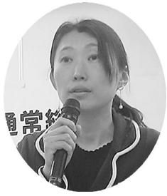
すぎなみ中央訪問看護 ステーション

しかし、実際には組合 員以外の方も受診し、健 康づくり活動に参加して います。これでは地域に 幅広く事業と活動を広げ ていくということについ て定款との矛盾が生じる