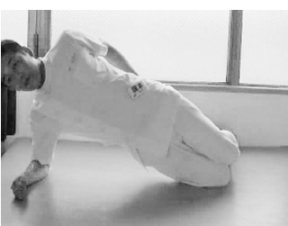
①片脚抱え込み運動

横向きで肘を曲げ、肩 肘をつく姿勢をとりま す。次に膝から上の身体 がまっすぐになるよう に、お腹を持ち上げます。 7秒間保ちましょう。