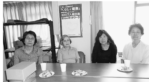
昨年6月準備会として

発足した「しゃべくり会」は、その後毎月開かれています。そして4月より新班になりました。テーマを決めないで、「しゃべりたいことを自由にしゃべる」をモットーとしています。まだ参加者は少ないですが、曜日が合えば参加したいという人もいます。 10時から12時まで診療所5階の組合員ルームで、お茶菓子を食べながら楽しくすごしています。会費は一回100円です。人と関わり、口を動かすことはたいへん良いことです。 一人住まいの高齢者が増えています。外に出ることもなく、一日中テレビを見て過ごす生活から抜け出すことができます。