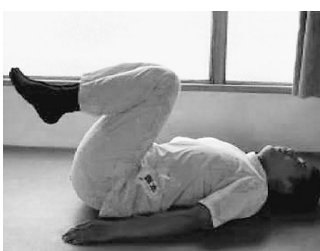
③横向きブリッジ運動

いない股関節の前面が伸 ばされていることを意識 します。呼吸は止めずに 10秒程引きつけます。